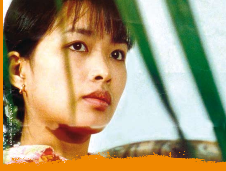
La Saison des goyaves

VENDREDI 9 OCTOBRE / ARSENAL - SALLE MARCEL OMS