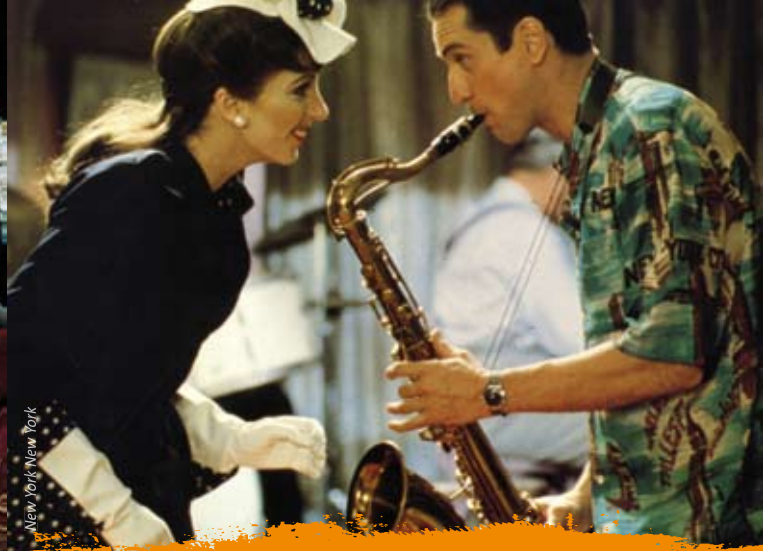
New York New York

MARDI 8 DECEMBRE - 19h / ARSENAL - SALLE MARCEL OMS