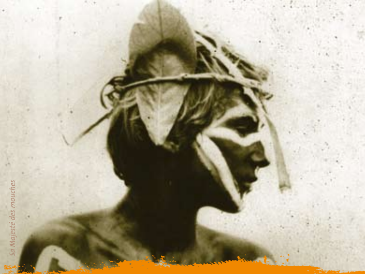
Sa Majesté des mouches